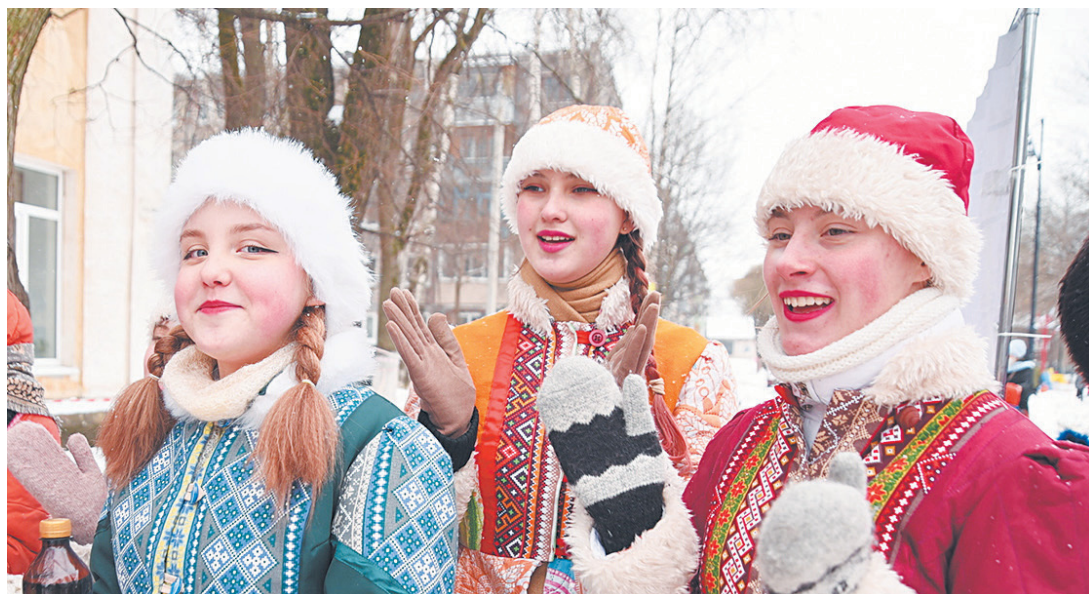
Около 500 вологжан посетило спортивные мероприятия.