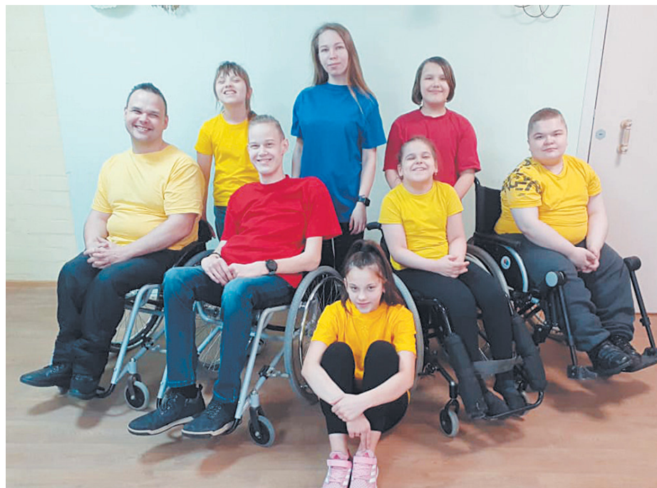
В танцах участвует пара: танцовщик на коляске и волонтер с обычным здоровьем.