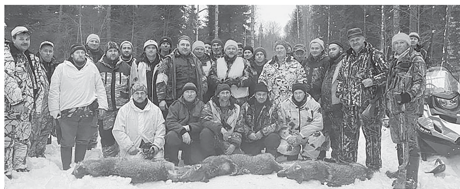
В охоте на волков участвуют десятки человек. На снимке - коллектив, который добыл 3 волков в охотхозяйстве «Вологодское».

В конце февраля в Вологодской области закрылась охота на кабана, пушных зверей и боровую дичь, но не на волка.