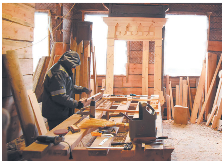
При реставрации дома на Чернышевского, 56, компания «Вологодские реставраторы» старается как можно бережнее подойти к исходному материалу. А вот вагонку для внешней обшивки здания изготовят вручную.

- Успешный опыт работы с инвесторами у нас есть, надеемся,