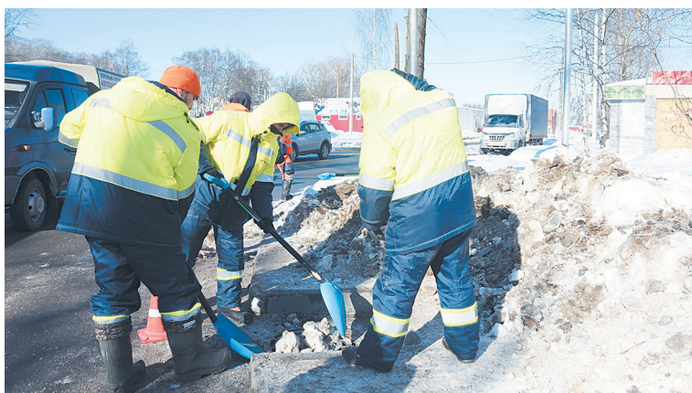
Сотрудники МУП ЖКХ «Вологдагорводоканал» чистят ливневую канализацию и дождеприёмные колодцы.

В НАСТОЯЩЕЕ ВРЕМЯ В ВОЛОГДЕ В ЗОНЕ ВОЗМОЖНОГО ПОДТОПЛЕНИЯ НАХОДИТСЯ ПОРЯДКА 150 ДОМОВ. СПЕЦИАЛИСТЫ СОВЕДУЮТ ИХ ЖИЛЬЦАМ ЗАРАНЕЕ ПРЕДПРИНЯТЬ НЕОБХОДИМЫЕ МЕРЫ: ПЕРЕНЕСИ ВСЕ ВЕЩИ С НИЖНИХ ЭТАЖЕЙ НА ВЕРХНИЕ, СОБРАТЬ ДОКУМЕНТЫ И ВЕЩИ ПЕРВОЙ НЕОБХОДИМОСТИ. В СЛУЧАЕ ПОДТОПЛЕНИЙ НУЖНО ОБРАЩАТЬСЯ В ЕДДС ПО Г. ВОЛОГДЕ: 72-45-00.