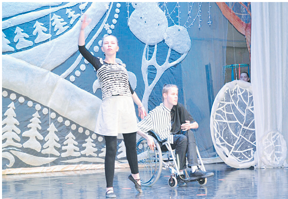
Танцы на колясках относятся к адаптивным видам спорта, но это еще и настоящее искусство.