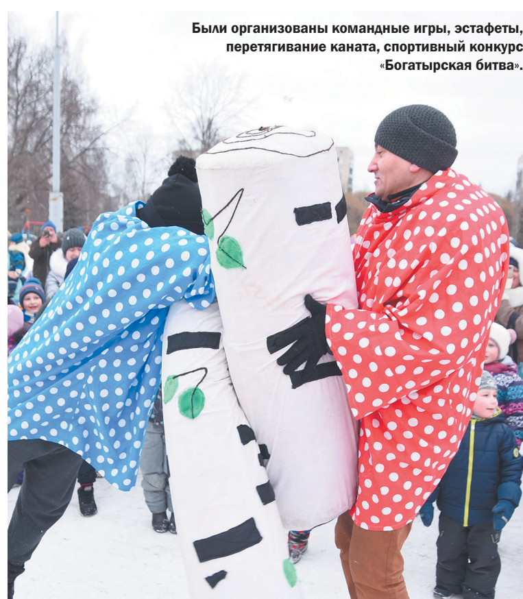
Были организованы командные игры, эстафеты, перетягивание каната, спортивный конкурс «Богатырская битва».

В выходные в областной столице прошли спортивные праздники в рамках общегородского фестиваля «Спорт – для всех! Спорт – для каждого!». Они состоялись на 20 площадках, которые были благоустроены в рамках федерального проекта «Комфортная городская среда» нацпроекта «Жилье и городская среда» или предложены жителями для возможного благоустройства в рамках этой программы в 2022 году.