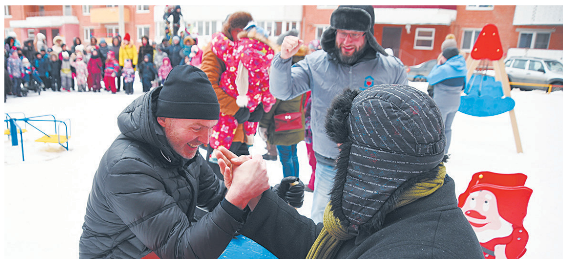
Организаторами спортивных мероприятий выступили ТОСы областной столицы при поддержке депутатов Законодательного Собрания области и Вологодской городской Думы.

Онлайн-голосование, в ходе которого каждый житель сможет высказаться за благоустройство конкретной территории в 2022 году в рамках проекта «Комфортная городская среда», пройдет с 26 апреля по 30 мая 2021 года на федеральной онлайн-платформе ( 35.gorodsreda.ru ). Там уже сейчас размещены правила голосования, а затем появятся конкретные списки территорий. В организации процесса помогут волонтеры, которые регистрируются на сайте dobro.ru .