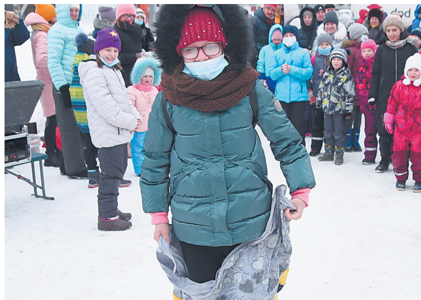
Праздники прошли на пл. Чайковского, на бульваре Пиригова и других площадках.