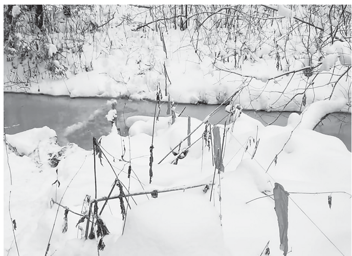
Оклад флажками - это сложная работа, требующая охотничьего опыта и знания местности, где обитает волк.

В целях безопасности жителям деревень и дачных посёлков необходимо исключить безнадзорное содержание домашних животных и не допускать стихийные свалки бытовых отходов. Обо всех случаях появления хищников вблизи населенных пунктов необходимо оповещать местные органы власти, телефон горячей линии Облохотдепартамента - 8(817-2)23-00-88.