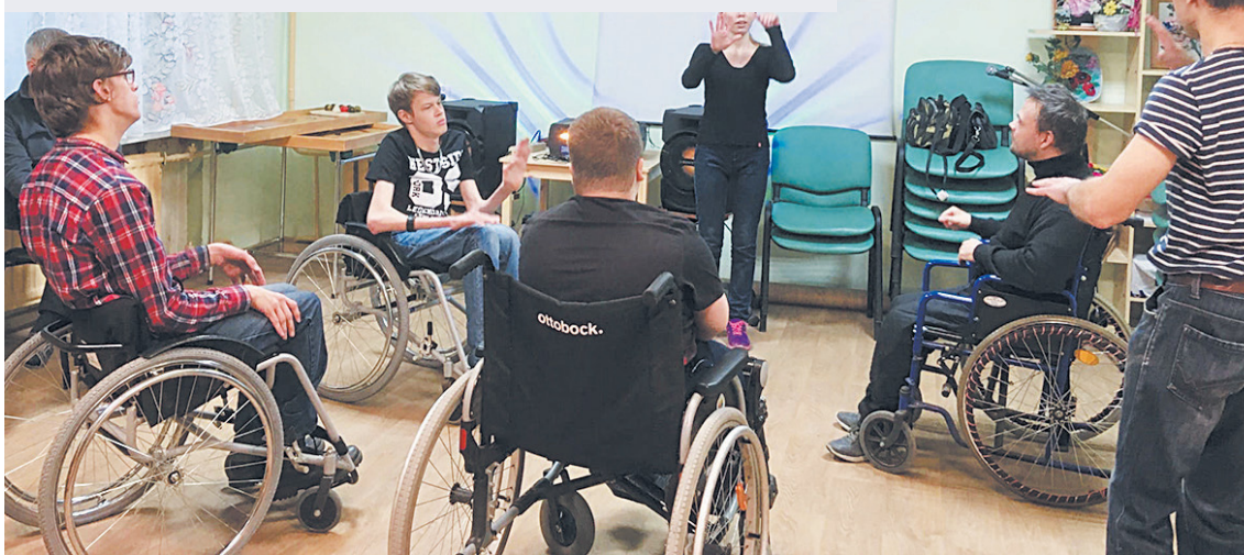
Танцы на колясках помогают поклонникам этого вида спорта обрести друзей и улучшить свою физическую форму.

2021 год. Диплом лауреата 3-й степени XVI Всероссийского фестиваля-конкурса творческих дарований и талантов «Наше время – зима» и Благодарность за подготовку участников. Диплом лауреата 3-й степени Международного фестиваля-конкурса «Жар-Птица России».