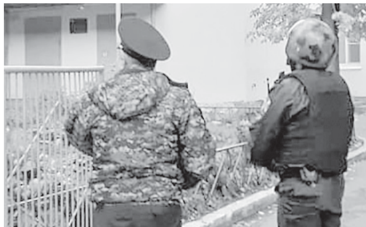
Оперативные службы проверили учреждения образования Вологды.

Между тем во всех школах областного центра усилили работу по обеспечению безопасности после трагедии в Перми, где 18-летний студент 20 сентября открыл стрельбу в местном университете, в результате чего погибли шесть человек и десятки пострадали. Стрелок был ранен и задержан.