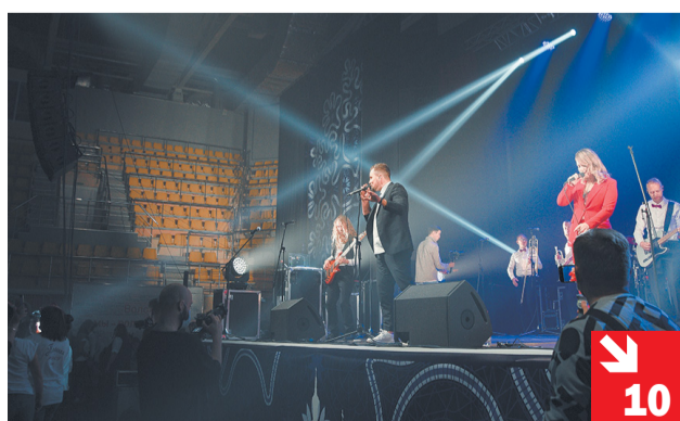
С ДЕТСТВОМ ПО ПУТИ: в Вологде отметили лучших воспитателей детских садов города.