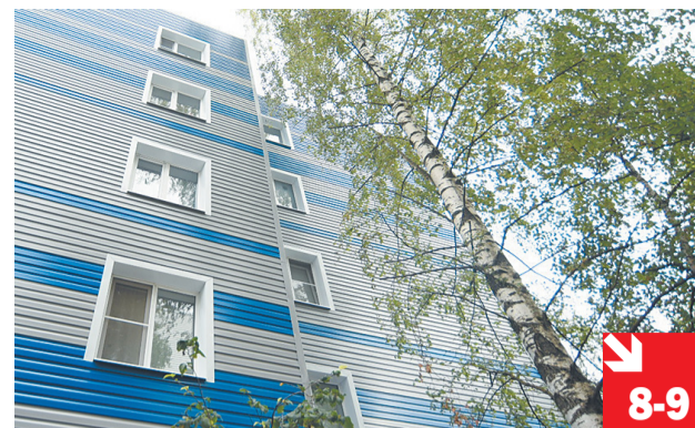
ПОД КРЫШЕЙ ДОМА СВОЕГО: как идут капитальные ремонты многоквартирных домов Вологды?