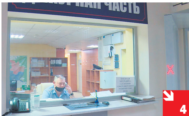
ВСКРЫТАЯ УГРОЗА: стало известно, кто стоит за угрозами терактов в Вологде.