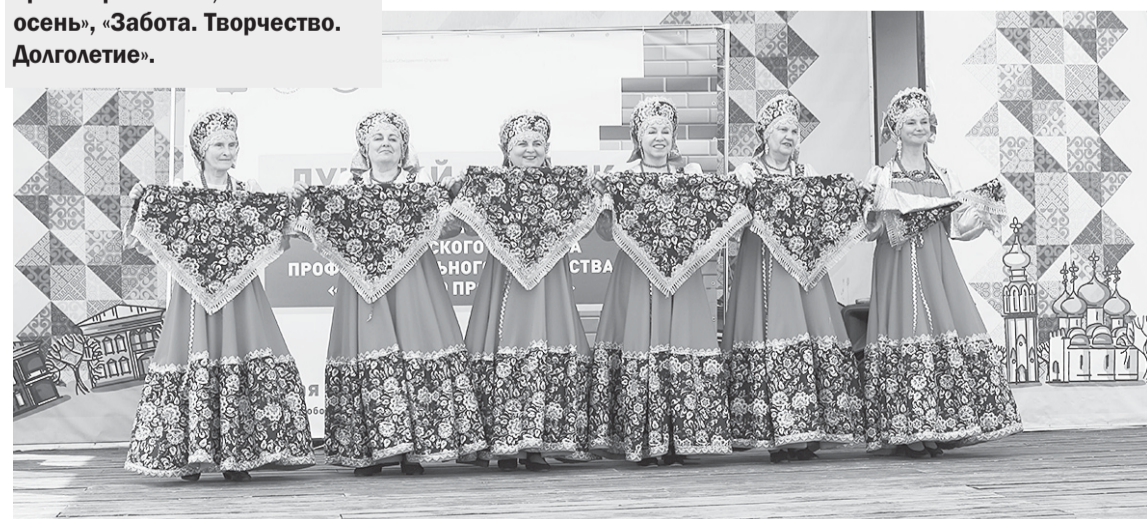
В центре создано множество творческих коллективов, которые активно выступают на общегородских мероприятиях.

КДЦ «Забота» вологжане старшего возраста могут посещать по семи адресам: Мальцева, 20; М. Ульяновой, 6; Преображенского, 49; Пионерская, 28; Михаила Поповича, 18; Монастырская, 16 и Маяковского, 3 (п. Молочное).