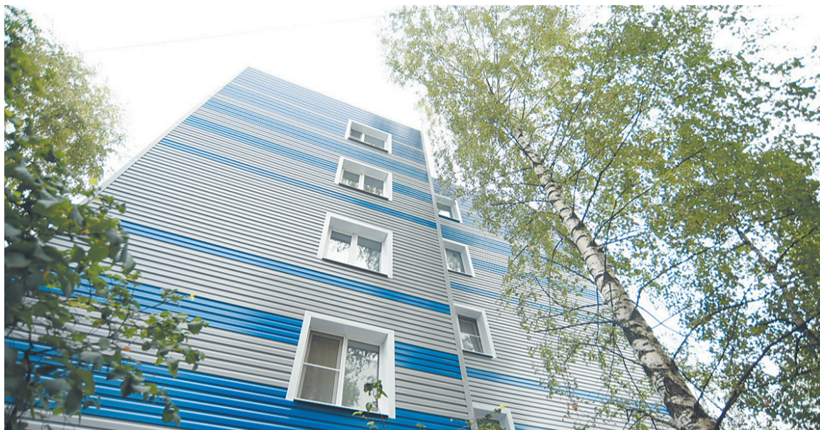
Фасад дома на ул. Панкратова, 66а УК «Подшипник» отремонтировала в этом году на средства со спецсчета.

Завершается капитальный ремонт 17 многоквартирных домов Вологды, которые вошли в областную программу на 2021 год.