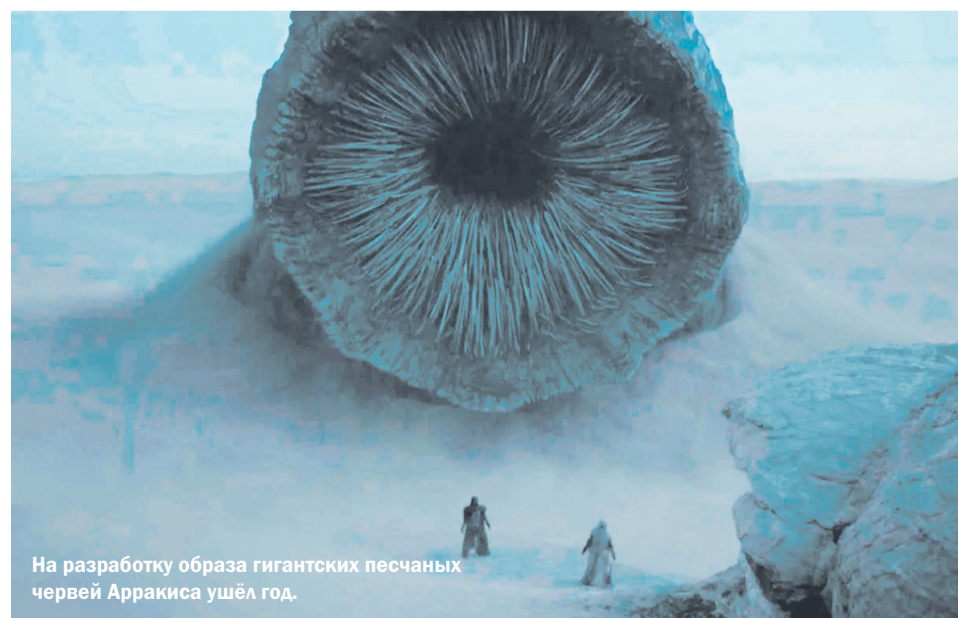
На разработку образа гигантских песчаных червей Арракиса ушёл год.