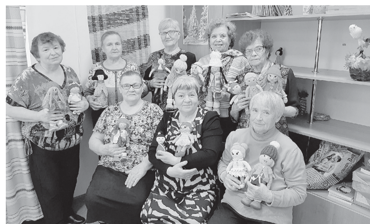
В «Заботе» ветераны вяжут, вышивают, занимаются спортом, постигают компьютерную грамотность. Всего создано 65 кружков и клубов по интересам.