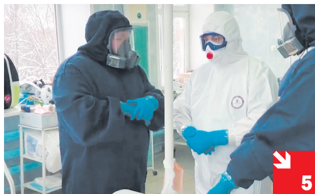
«МАМА, РОДИ МЕНЯ ОБРАТНО!»: реальная история о том, как работает многогоспиталь Вологды.