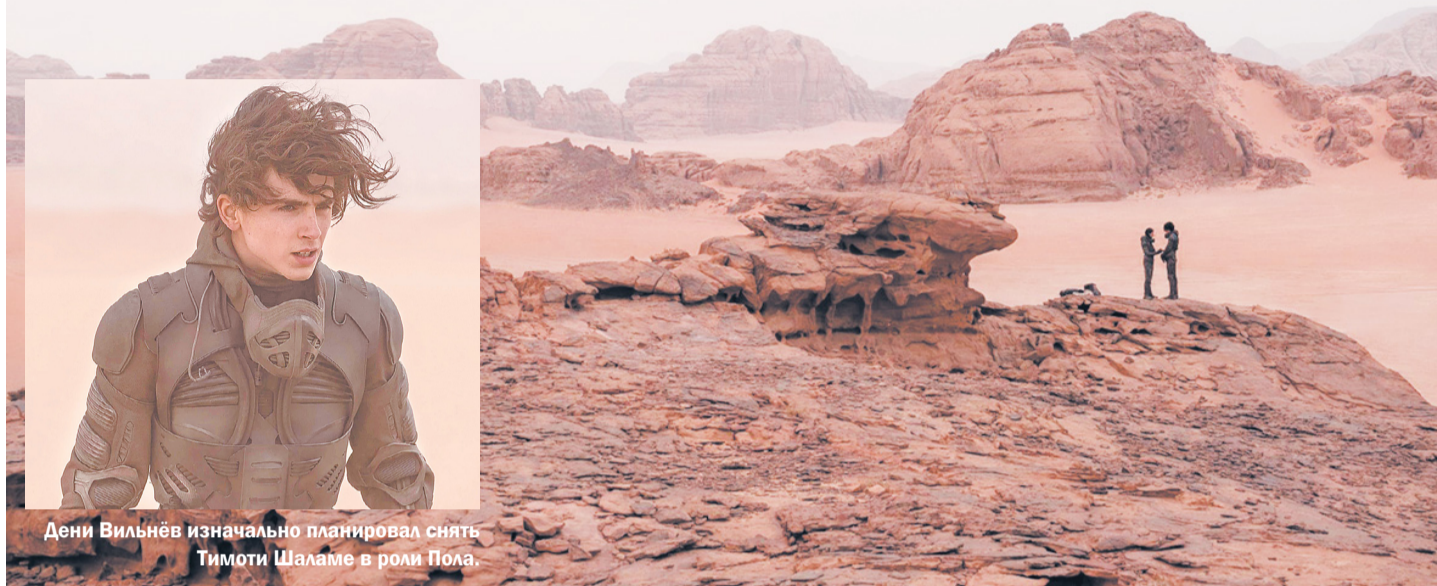
Дени Вильнёв изначально планировал снять Тимоти Шаламе в роли Пола.

Вологжане посмотрели долгожданный фильм «Дюна» (12+) и делятся впечатлениями в соцсетях.