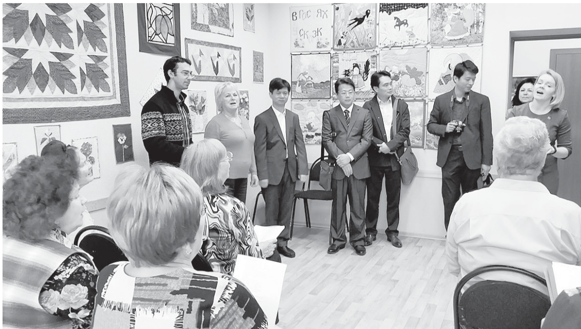
Деловая делегация из города Интань (Китай) посетила центр «Забота», где увидела, как вологжане старшего поколения занимаются цигун.

1 октября отмечает десятилетний юбилей культурно-досуговый центр «Забота».